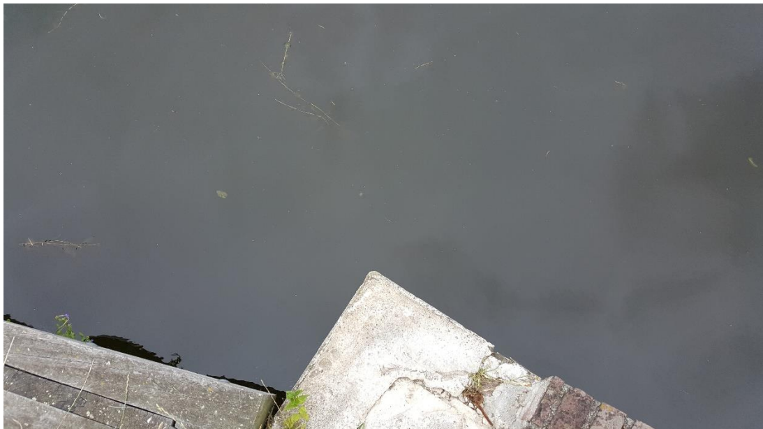
Figuur 4: Foto locatie tijdens veldbezoek op 16 juli 2019.