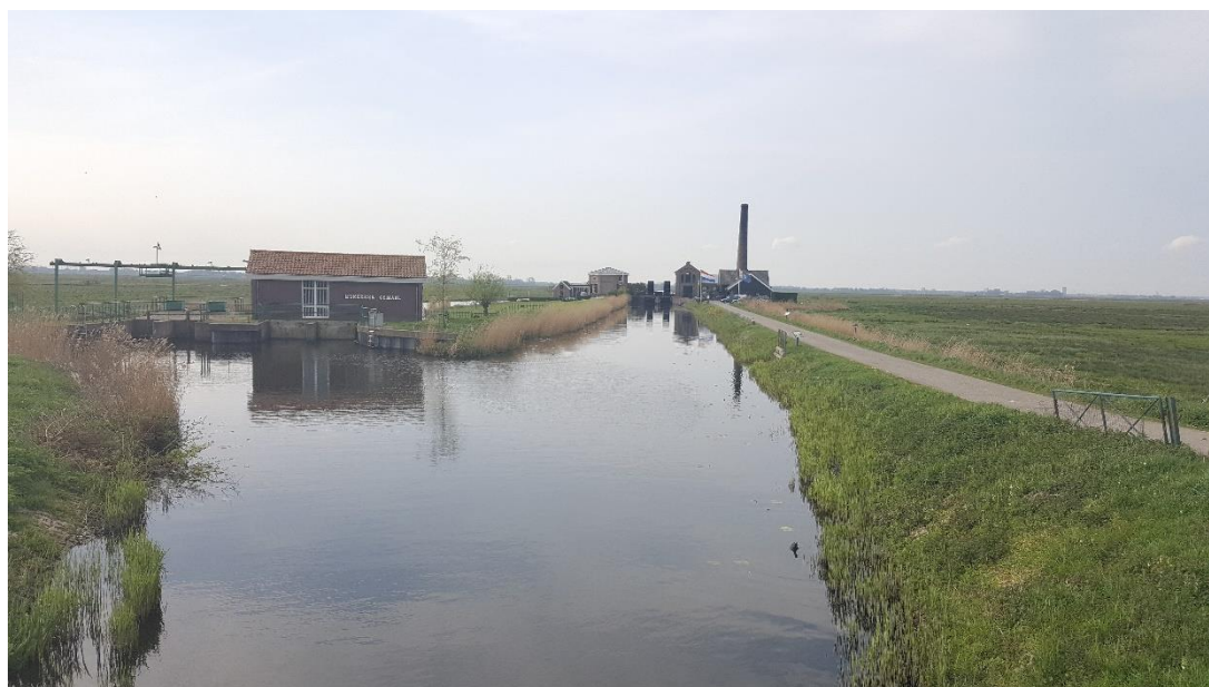
Figuur 6: Foto locatie tijdens veldbezoek op 17 april 2019 (bovenstrooms Wielse Sluis).