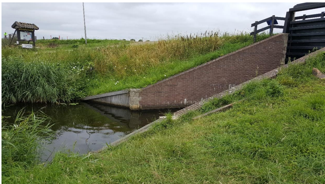
Figuur 3: Foto locatie tijdens veldbezoek op 16 juli 2019.