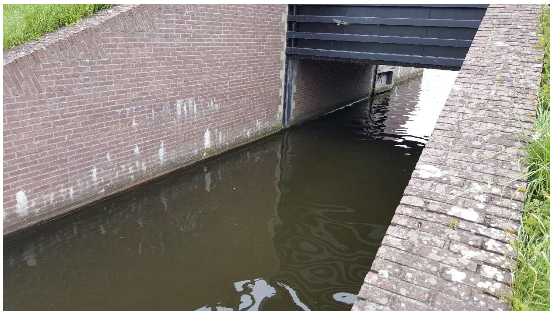
Figuur 2: Foto locatie tijdens veldbezoek op 16 juli 2019.