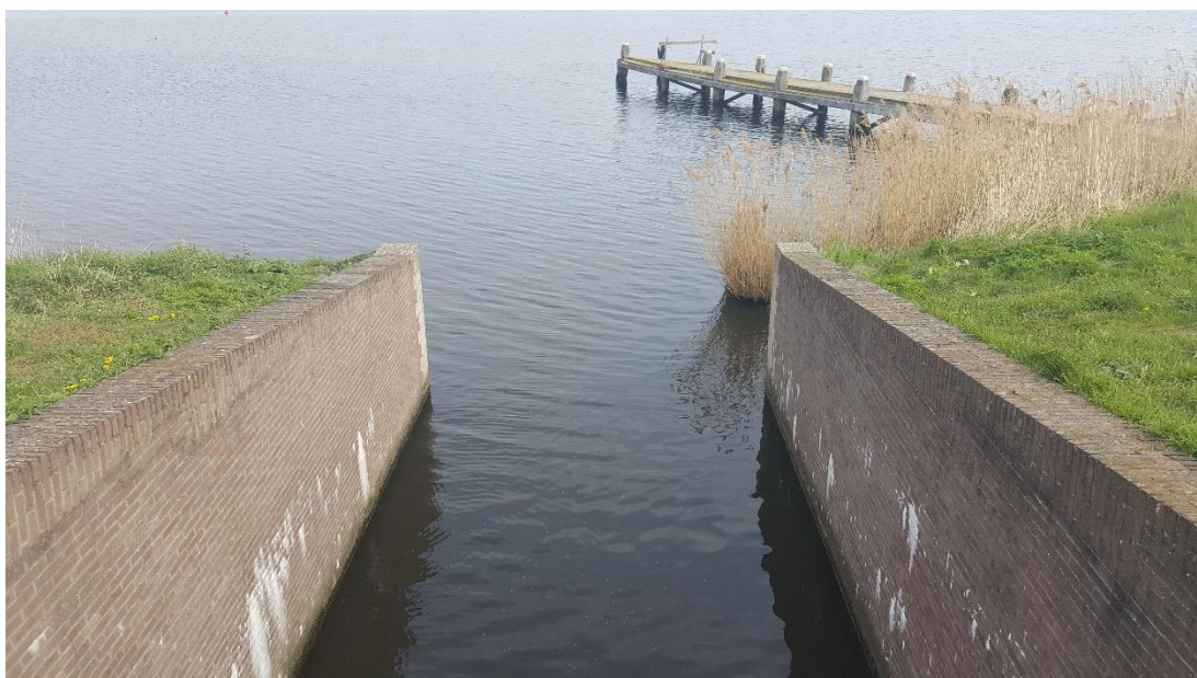
Figuur 5: Foto locatie tijdens veldbezoek op 17 april 2019 (benedenstrooms Wielse Sluis).